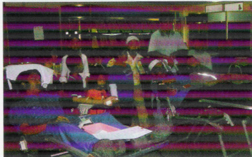
Kakitangan Agensi Nuklear menderma darah