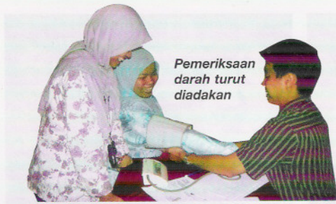
Pemeriksaan darah turut diadakan